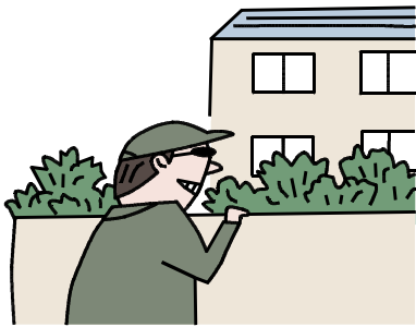
柏市内における侵入窃盗の被害状況

また、年末年始においては、ご実家等に帰省している間の留守宅を狙った空き巣等の侵入窃盗が増加する可能性があることから、12月から翌年の1月にかけても引き続き被害が多発することが予想されます。戸締まり等の基本的な対策はもちろんのこと、センサーライトや防犯フィルム等の防犯グッズを活用するといった各種防犯対策を実施し、泥棒が寄りつかない環境作りを心掛けましょう。